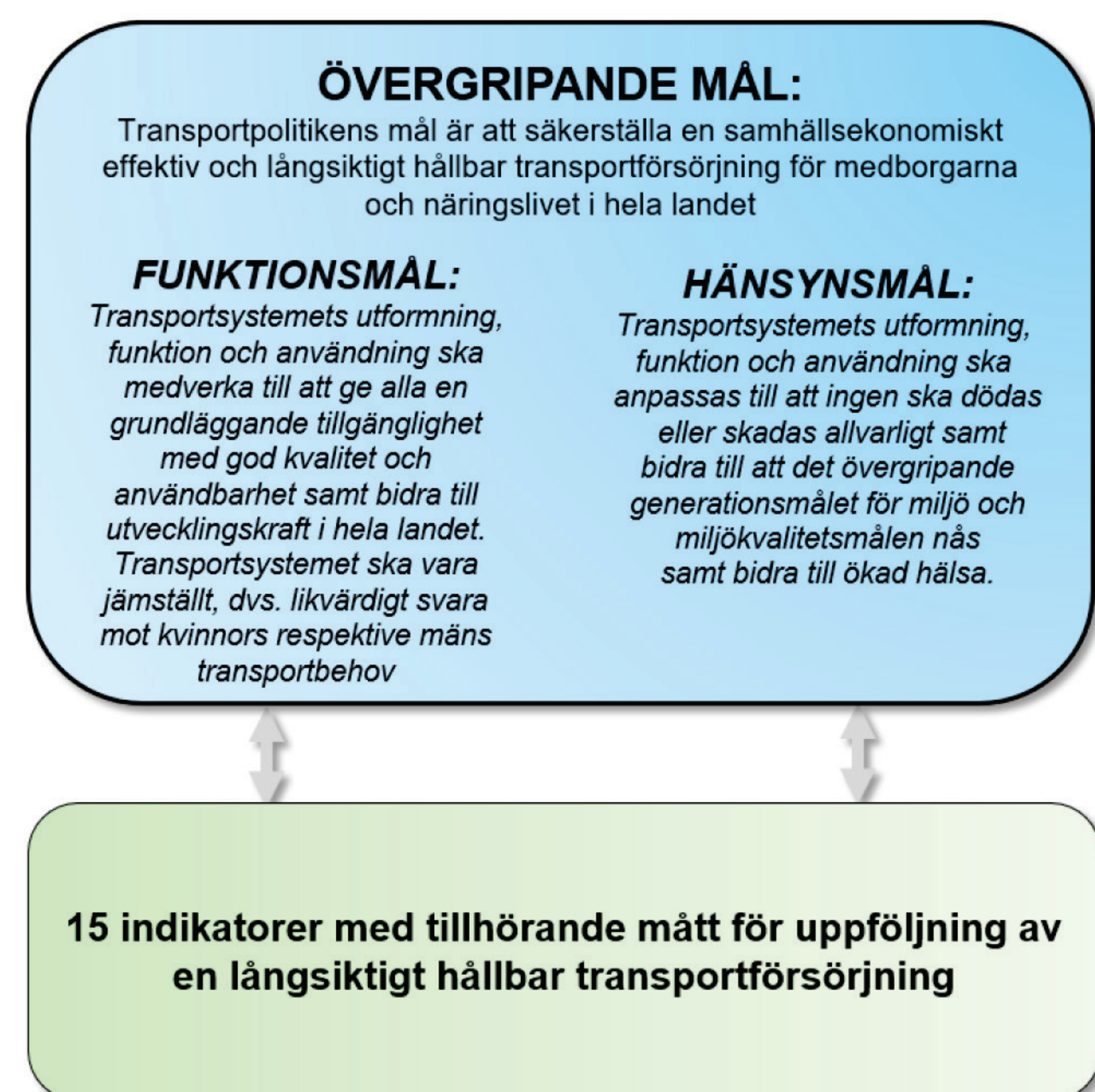
Figur 1. De transportpolitiska målen.

De transportpolitiska målen fastställdes av riksdagen 2009, och består av ett övergripande mål, ett funktionsmål och ett hänsynsmål. Funktionsmålet förtydligar vad transportsystemet ska bidra med, det vill säga skapa tillgänglighet och därmed utvecklingskraft för medborgare och näringsliv. Hänsynsmålet uttrycker att tillgängligheten inte ska utvecklas på bekostnad av trafiksäkerhet, människors hälsa eller miljön.