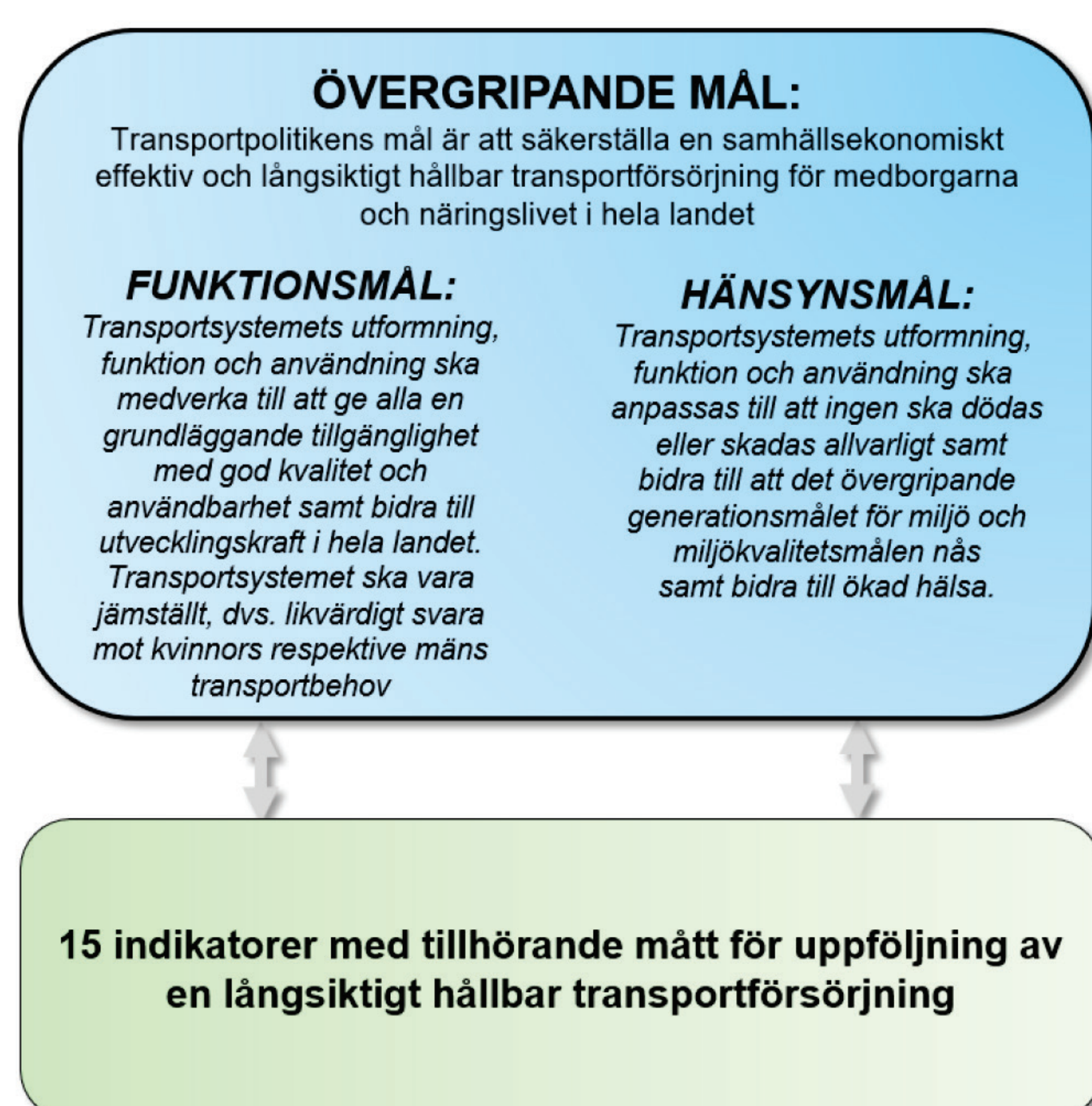
Figur 1. De transportpolitiska målen.

De transportpolitiska målen fastställdes av riksdagen 2009, och består av ett övergripande mål, ett funktionsmål och ett hänsynsmål. Funktionsmålet förtydligar vad transportsystemet ska bidra med, det vill säga skapa tillgänglighet och därmed utvecklingskraft för medborgare och näringsliv. Hänsynsmålet uttrycker att tillgängligheten inte ska utvecklas på bekostnad av trafiksäkerhet, människors hälsa eller miljön.